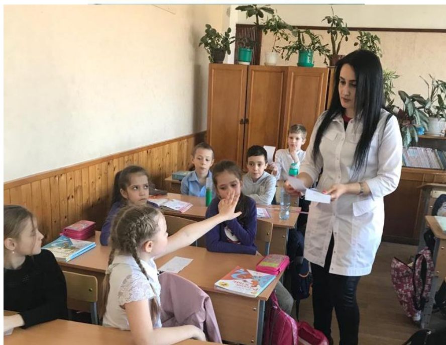
Акция «Белая ромашка», раздача листовок.