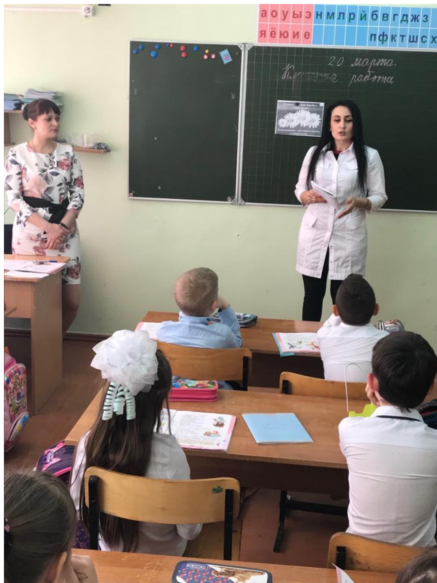
Урок здоровья в начальной школе «Осторожно, туберкулез!»