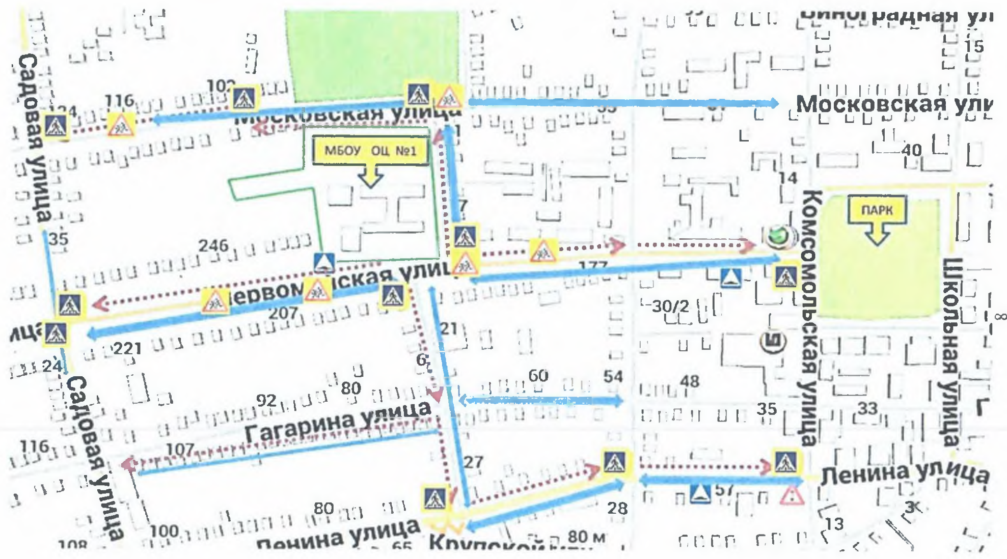
Схема организации дорожного движения в непосредственной близости от МБОУ ОЦ №1